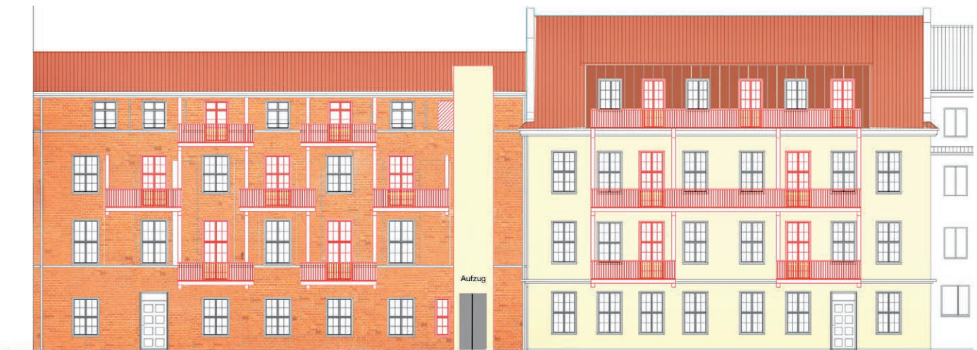
Ansicht Innenhof Poststraße 4 - 6