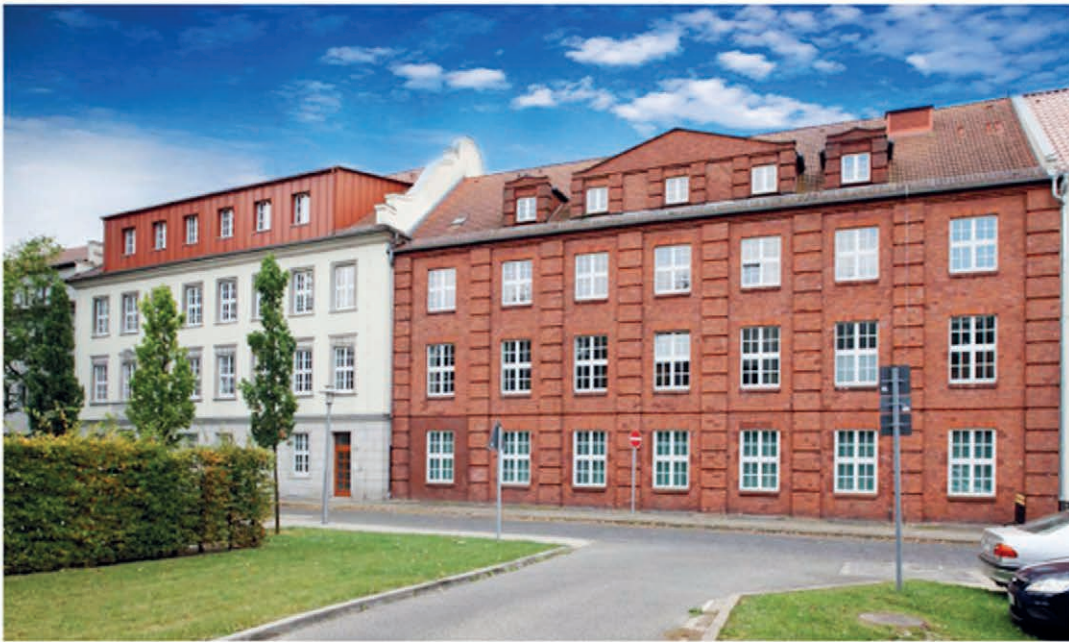
Außenansicht Gebäude 3